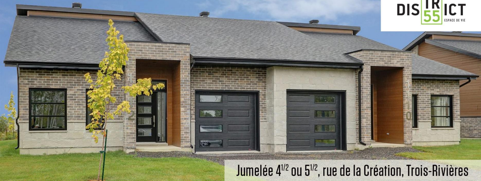
Jumelée 4 1/2 ou 5 1/2 , rue de la Création, Trois-Rivières