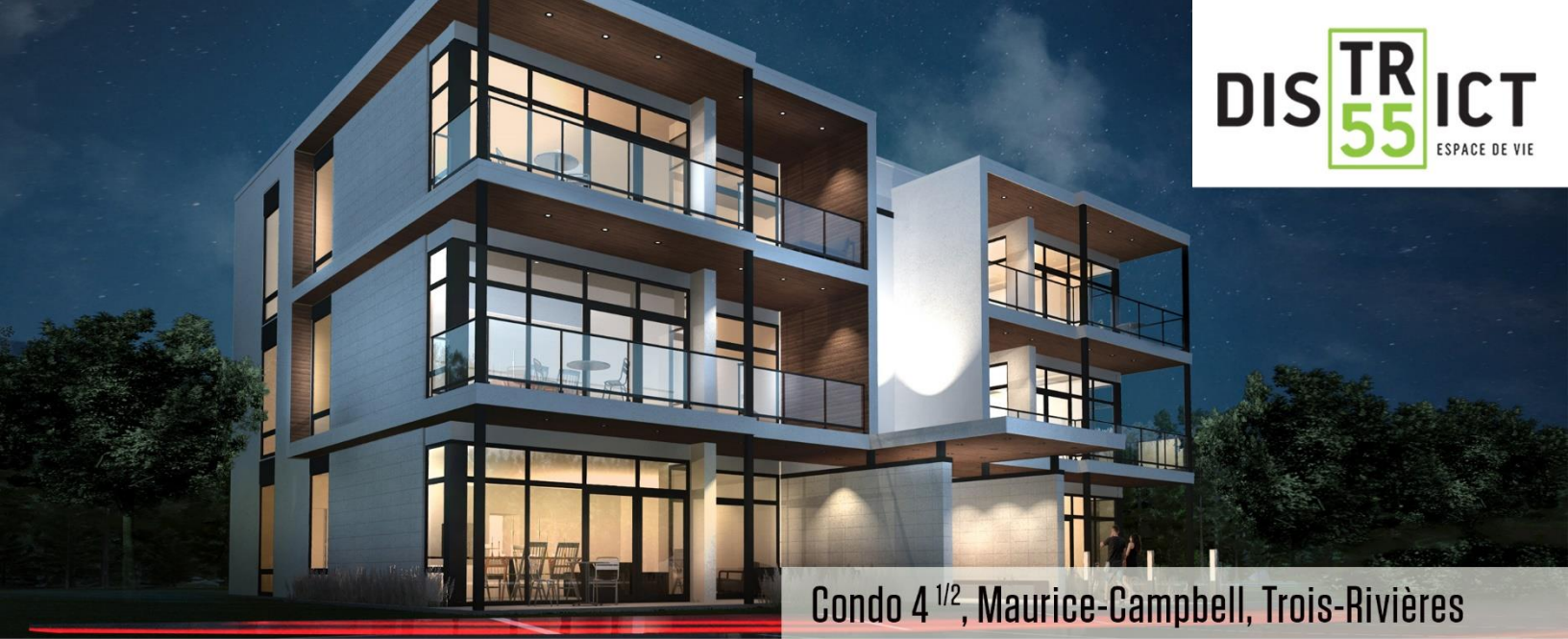
Condo 4 1/2, Maurice-Campbell, Trois-Rivières