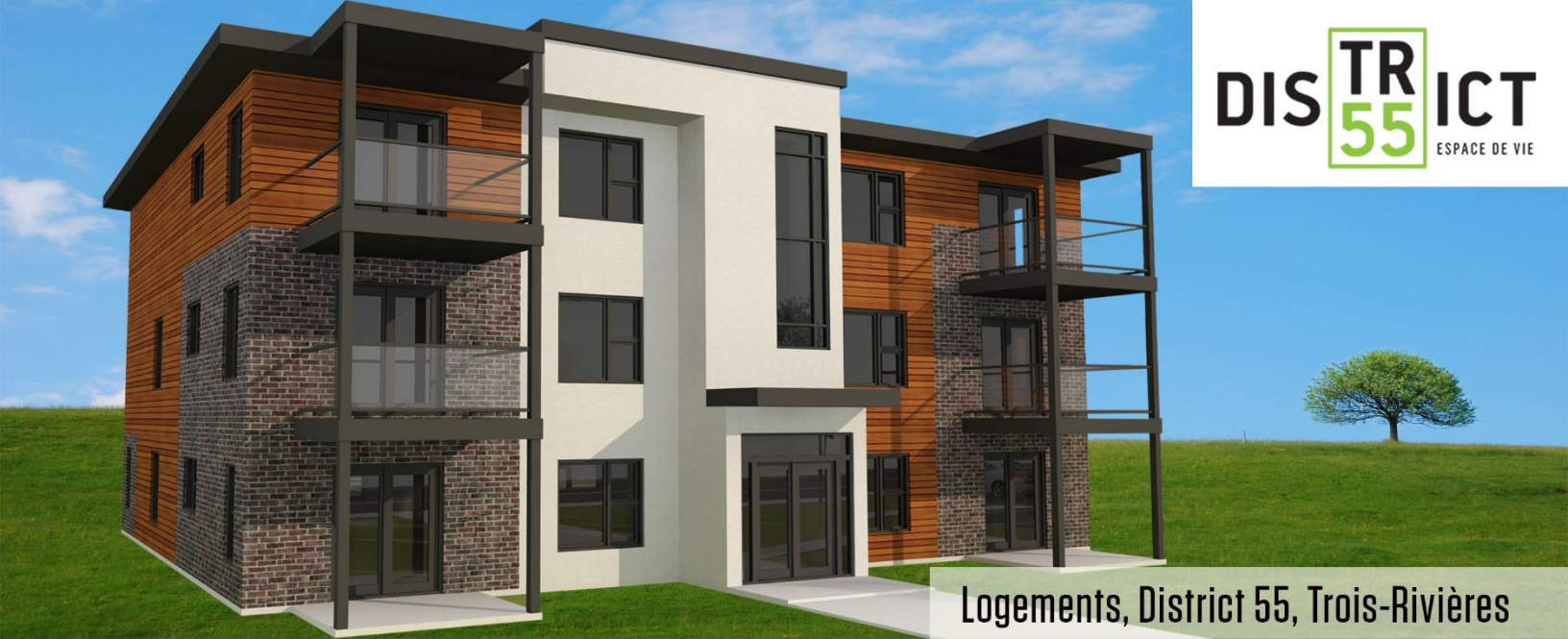
Logements, District 55, Trois-Rivières